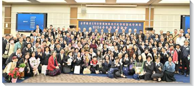
▲聖徒們參加壯年班暨延伸訓練畢業聚會

一位姊妹見證，因學歷較低，深怕自己跟不上訓練的要求，直到召會生活遇到瓶頸，選擇一年可以抵十年的壯年班訓練。天天接受強大的真理輸供，更新奉獻，漸漸突破閱讀障礙，在寫申言稿、各項考試以及書報報告