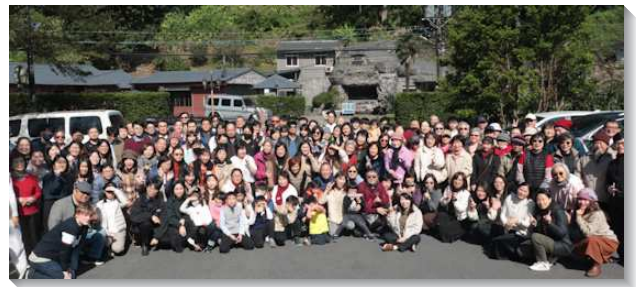
▲聖徒參加年終數算主恩暨相調聚會

最後，弟兄們也交通到新的一年有四方面的展望：第一，裝備真理。鼓勵弟兄姊妹參加一年七次的特會訓練，並追求生命讀經，以進入聖經。第二，廣傳福