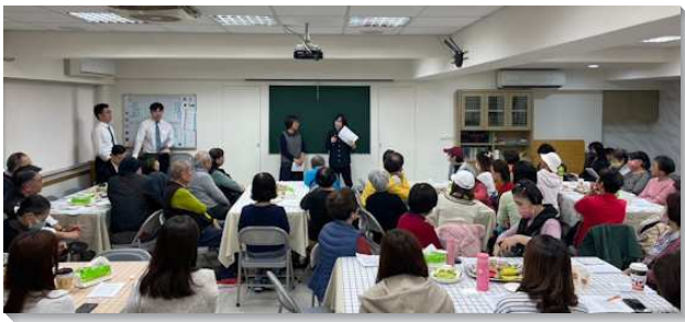
▲聖徒們配搭福音聚會傳福音

然而因著大區內弟兄們的交通，需要鼓勵聖徒，人人列名、小組禱告、交通名單、出訪邀約。我們就開始同聖徒們交通福音的負擔。也邀請其他大區在實行上有蒙