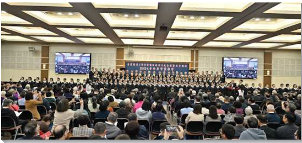
▲壯年班暨延伸訓練畢業聚會在中部相調中心舉行

藉詩歌『在主裏的長進』揭開序幕，第一組有八位學員作見證。來自美西的弟兄交通，他信主三十多年，聚會落入例行公事。受訓期間禱告得復興，真理認識更高更深，每日生活的規律要求成甜美管制，藉福音開展重燃愛人的心。每項服事都是從團體的禱告起頭，看見這是一個團體神人生活的模型，願意接受主重新製作與甄陶。一對夫妻見證，弟兄在職場上是董事長，在壯年班操練洗浴廁馬桶，體會主耶穌降卑洗門徒的腳之愛。