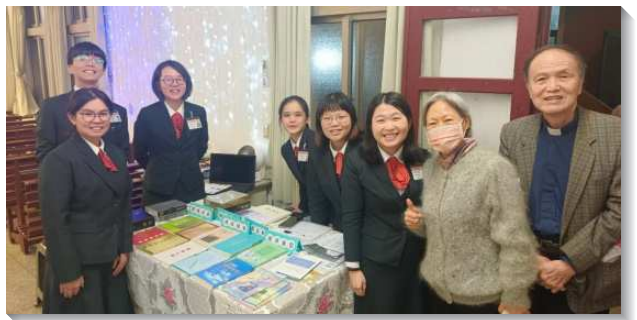
▲學員至各地推廣聖經真理書報

在每天出發前，學員們都會齊聚一起追求主的話，使我們先被主的話充滿，能滿有力量的出去供應基督。藉著在身體中同心合意的配搭，學員們不僅推廣書報，也在當地不容易帶人得救的地方結了果子。有一次，學員在原本要拜訪的會堂附近，遇到敞開的鄰居伯伯，他用台語說了許多人生故事，雖然學員們受語言的限制，但仍然在靈裏傳講受浸的真理，伯伯最後也敞開的答應受浸得救。這使學員們經歷，在身體的配搭裏就帶下主的祝福，藉著學員們的去，使當地的聖徒得激勵，喜樂的一同交接新蒙恩的弟兄。