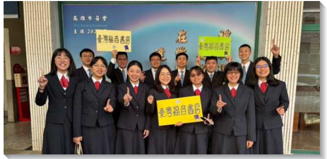
▲學員至各地推廣真理書報

在推廣的過程中，看見我們不是單獨的肢體，藉著每一次出發前與在路程中不住的禱告，操練禱讀、背誦主的話，使我們戴上救恩的頭盔並那靈的劍，在同心合意的靈裏配搭。學員們經歷不只與當地的聖徒有甜美的交通，也一起到各會堂推廣書報，同作職事的推廣者。在參與讚美操、讀經小組以及到各個會堂推廣書報時，看見每個肢體都擺上自己的那一分，眾人如同一人。學員們真實經歷以弗所書四章十六節『本於祂，全身藉著每一豐富供應的節，並藉著每一部分依其度量而有的功