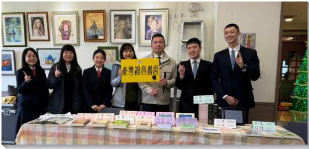
▲學員與聖徒配搭書報推廣

在這次書報推廣中，因著已過在訓練中對真理的追求和裝備，使學員們能彀把恢復本聖經中註解的亮光以及職事信息的豐富，正確的向人陳明。有一次，學