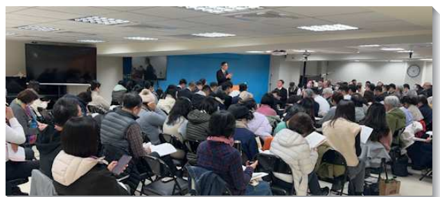
▲中山大同區半年度訓練在七十四會所舉行

區六個會所的聖徒們，一同進入主今時代的說話，藉由弟兄們釋放話語，以及加強、分享和考試，聖徒們都被信息深深摸著，而有即時的回應。聖徒們在招待、整潔、飯食、兒童等服事上順服安排，在身體裏同被建造，經歷以弗所書二章十五節所說，『在祂的肉體裏，廢掉了那規條中誠命的律法，好把兩下在祂自己裏面，創造成一個新人，成就了和平。』雖然有時在配搭服事上，會因著調整覺得為難，但藉著主話語即時的供應，就在身體的配搭裏經歷一個新人。