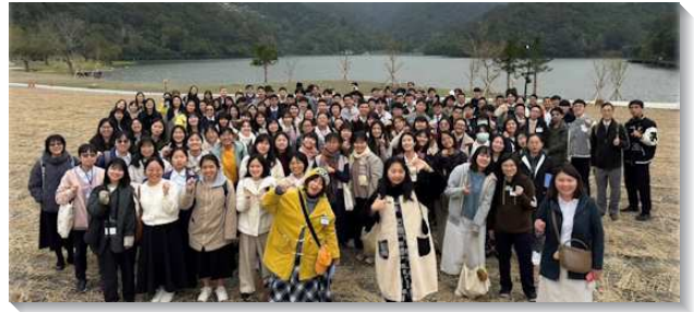
▲大安區大學聖徒期末特會外出相調

本次特會交通國度的生活與操練，不僅說到國度的道理，更摸到我們平時的生活。第一篇信息說到在活力排中過國度的生活和召會生活。第二篇信息說到國度子民的義行、性質與生活。有學生分享他為融入同儕，就使自己過著與同學相似的生活，但聽見信徒在地上要作鹽，不該失了味，就使他觀念改變，看見不該模成這世代的樣子。第三篇信息說到為著國度的禱