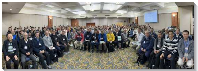
▲聖徒們參加新春相調聚會

另一方面，許多蒙恩多年的聖徒也深深受光照，看到自己長期停留在老舊的光景中而不自知。在信息中得著主新的顯現，願意更新奉獻，求主使我們的召會