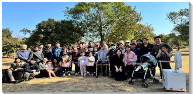
▲金門隊將新人與福音朋友調進身體中

金門隊藉著與聖徒們密切的交通與配搭，在當地建立起一種新鮮且滿了活力的召會生活型態。在一整天的生活中，學員與聖徒們一同交通、禱告，出去叩門探望人，也將敞開的人邀約到會所吃飯。這樣新鮮有活力的召會生活，彷彿是使徒行傳二章四十六節中初期召會生活的翻版。四十七節說到，這樣的召會生活的結果，就是主將得救的人，天天和他們加在一起。藉著與聖徒們一同經營召會生活，就使福音朋友自然而然受浸得救並調進身體裏，學員們也將人帶進主日聚會中，一同擘餅記念主，使主得著榮耀。