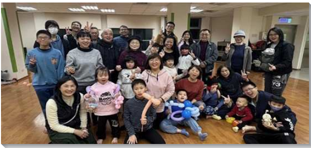
▲新北淡水隊與聖徒同心配搭服事兒童排

在這五週的開展中，學員們操練時時享受三一神繁增的恩典，而成爲神諸般恩典的好管家，將恩典供應給聽見的人。本次共有一百六十一人相信受浸，五百二十九人有分家聚會，累積至第五週帶人參加主日達九十位，有一百三十九位入排，並成立十四個小排。各地召會聖徒也非常踴躍配搭身體的行動，五週共有約五千一百四十七人次的聖徒一同出外接觸人。以下爲幾處蒙恩。