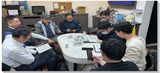
▲新北板橋隊用主話牧養人邀約人入排

新北淡水隊爲著兒童排能帶進更多新的家，每週來在一起禁食禱告。每一次的禱告都使學員從外面的事物轉向主自己，看見不能憑著自己作什麼，乃要讓主作。藉