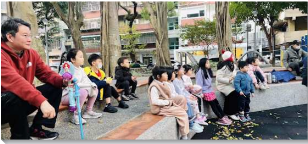
▲兒童們專注參與公園兒童排

的時間與地點。由於當時其他公園都在整修，許多附近的居民都選擇聚集在同一個公園，來到公園遊憩的有些家也彼此認識。因此只要能帶進幾個敞開的家，就有機會藉著他們來接觸更多的家，帶進召會生活。這幾週我們確實蒙了主的祝福，總共接觸到十二個敞開的家長，並且有一個家直接帶進現有的兒童排。願主繼續帶領並使用公園兒童故事屋，以得著更多關鍵的家。