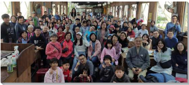
▲聖徒們參加新春外出相調

物及農村生態風光，看見神美好的創造，讓人心曠神怡。大家唱著詩歌主前同歡聚，靈裏高昂又喜樂！