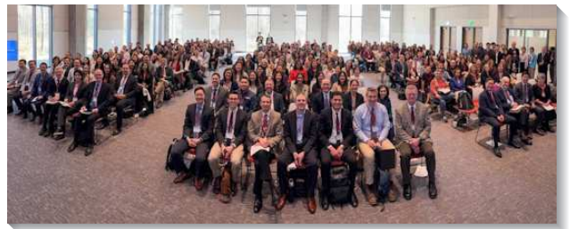
▲聖徒赴美參加北美路加聖徒集調

第二篇信息交通到 Experiencing, Enjoying, and Expressing Christ in the Environment of Caring for People, 弟兄強調路加聖徒要經歷並享受包羅萬有的基督，才能