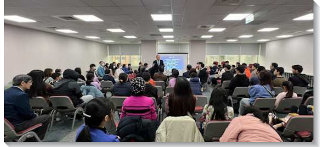
▲得榮基金會得榮少年證書頒發暨福音聚會

另一位同學說，他成為得榮少年之前，有參加學校的舞獅行春，行春時需要祭拜，這成為他想要受浸的阻礙。關懷者們鼓勵他先簡單相信與接受，之後主耶穌會來開路，所以少年就在去年八月受浸了。受浸後他不想再去舞獅，雖然沒有外面的活動，但在召會中認識很多同伴，一起去作公服、海灘淨灘，受浸後太喜樂了。