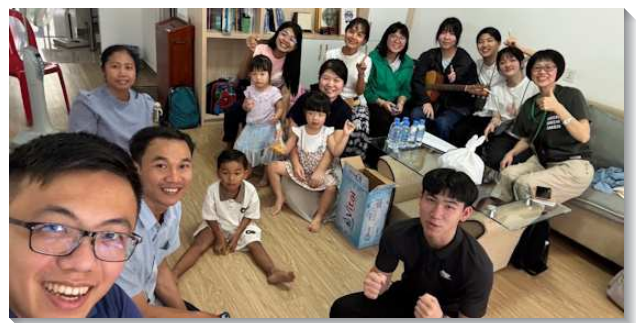
▲聖徒至柬埔寨的金邊與暹粒福音開展

的奧秘』，帶領當地人認識福音。儘管語言有所障礙，但聖徒們在基督裏同心合意，不受語言限制，靠著主的恩典傳揚福音。聖徒分享在這次開展中，看見弟兄姊妹的榜樣，也受激勵放膽開口傳講，就經歷主的同在與能力。儘管天氣炎熱，環境條件艱難，甚至身體疲憊，當地聖徒仍甘心樂意服事，讓他們深受激勵。