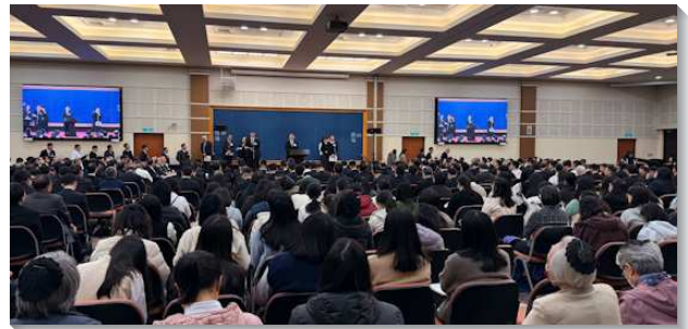
▲ 全台同工於成全訓練中分享

另有各專項事奉的研討交通。在兒童專項中，盼各地能善用兒童普查得兒童也得家長。並藉此充分照顧所有聖徒的兒女，加強兒童聖別主日，積極帶進大量福音兒童。另外要關心嬰幼兒及家長，和規劃小五六兒童救恩