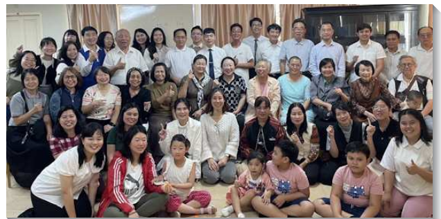
▲大學聖徒至泰國福音開展

普吉的腹地很廣，但當地的姊妹卻願意出代價，騎一小時的車來配搭開展，盼望主能繼續在當地校園得著愛