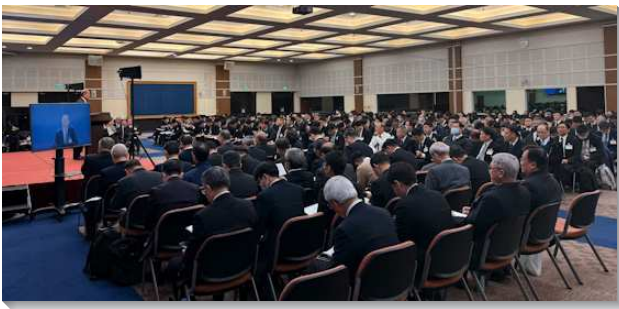
▲ 全台同工成全訓練在中部相調中心舉行

訓練的第一篇信息，弟兄點出我們可能知道異象這詞，但不一定看見異象，而看見了異象，也不一定會留在異象中。我們需要看見神經綸的異象，被這異象管制、指引、保守，使我們留在真正的一裏。而神經綸的中心異象，就是基督與召會—這極大的奧祕。我們也要看見主的恢復獨一的中心點，乃是一神團體的彰顯，就是耶穌的見證。他們一面藉著被神充滿，成為神的豐滿；另一面也是金燈臺，作三一神的具體化身和彰顯。