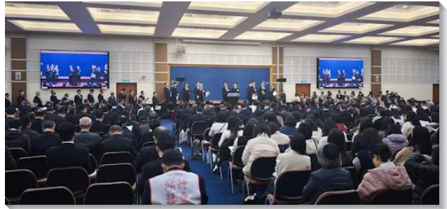
▲ 全台同工們參加成全訓練

第四篇則說到純淨與中心點的關係。主的恢復是獨特的，在主的恢復裏我們必須被潔淨，脫離各種攙雜。巴比倫的原則就是把人的東西和神的道混在一起，我們要恨惡巴比倫的原則，成為聖別の種類，從一切攙雜中得潔淨。因此我們的心、良心和靈裏需要純潔。清心的人必看見神，也要有無虧的良心和清潔的良心，並把靈裏一切攙雜的成分對付乾淨，使我們的事奉一直在神經綸的中心線上。第五篇帶我們看見神獨一的路。神是獨一的，基督是獨一的，召會在宇宙中和地方上都是獨一的。這職事也是獨一的，分賜神聖的三一，以產生召會作基督的身體。我們必須清楚看見這個中心點，否則我們所作的，最終會產生另一個工作。第六篇是加強的題