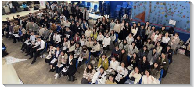
▲大安區大學聖徒春季期初特會

主耶穌第一次的來並不是在外面有甚麼活動或運動，祂來乃是將國度的種子撒在所揀選的人裏面，並且祂來乃是作醫生、牧人和莊稼的主。我們若要傳揚國度的福音並使萬民作主的門徒，不是在於是否有許多外面的活動，乃是在於我們裏面是否與主有許多的調和。