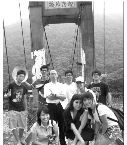
▲ 三十九會所大學聖徒 在新竹內灣合影

在這次出外相調中，大家都對主有更多享受與經歷，也讓兩位福音朋友對主有進一步的認識。我們實在不虛此行。（鄭訓宏）