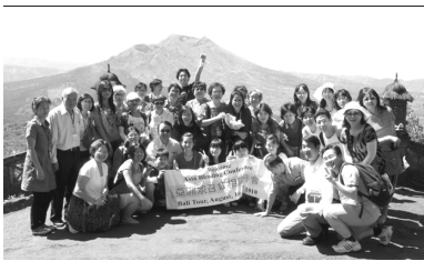
▲弟兄姊妹在印尼喜樂相調

第一篇為在新約經綸中信的經歷，說到神的喜悅在於我們信祂。第二篇論到享受神聖的分賜，以完成神聖的經綸。第三篇交通在基督獨一的元首權柄下並在獨一的神聖交通中，實行召會生活。第四篇說到實行福音的祭司職任並過奉獻的生活，以完成神永遠的定旨。第五篇說到堅定並生機的繁殖擴增主恢復的見證。末了一堂說到產生新的一代起來事奉繁殖擴增主恢復的見證。一位弟兄見證，雖然他有龐大的事業，但他乃是先顧到神的需要。他教導孩子們，任何事都能商量，惟有主的事不能討價還價。他也鼓勵眾聖徒，好好成全下一代。