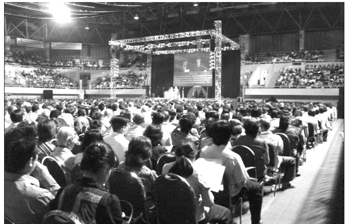
▲亞洲眾召會相調特會現場

主日上午，眾人一同擘餅記念主。中午結束後，我們前往全時間訓練中心參觀。從一九九五年至今，已有近五百位青年聖徒接受訓練，目前有一百八十位全時間服事主，在印尼各地成為祝福。