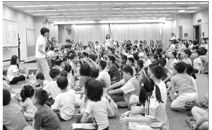
▲ 暑期親子健康生活園現場

第三天上午，家長分享蒙恩與心得，非常深刻感人。他們都樂意按部就班的操練過神人生活。下午兒童的申言展覽更是精彩，人人摸著這次『親、熱、就』的負擔，渴望家聚會，願向同學傳福音，並邀請他們到家中參加兒童排。（廖熊正儀）