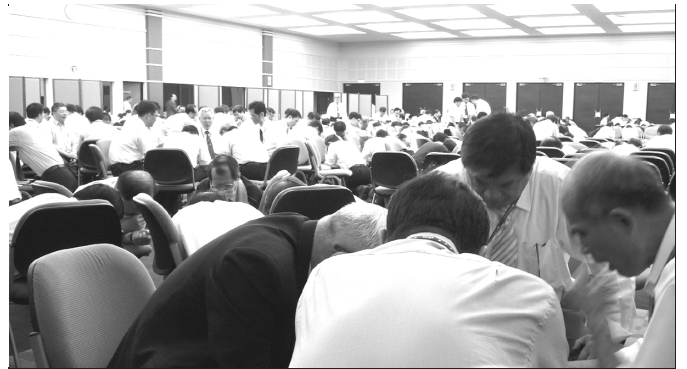
▲ 弟兄們為今年召會各項行動迫切的禱告

這次訓練總題為『神永遠的定旨成為我們榮耀的定命』。第一篇說到『作神永遠定旨的召會及神與人的宇宙羅曼史』。神永遠的定旨就是要得著召會，這是我們榮耀的定命。因此，青年人要藉著價值觀的改變，過奉獻的生活。第二篇說到『神殿與神城的恢復』。主今時代的恢復，乃是將眾聖徒聚在一起，在各城市同被建造成為神的家、神的國，以完成祂的經綸。因此，青年人要操練過團體的神人生活，參加小排、禱告聚會、主日聚會；年長聖徒把家打開，將青年人帶進召會生活裏。