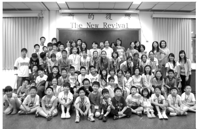
▲ 南一區暑期兒童品格成全聚會在三會所舉行

另外，三會所兒童服事者及家長看重暑期兒童屬靈的生活，週中多有相調、代禱，並且彼此邀約，相較去年六個家參加親子健康生活園，今年共有十四個家參加；其中有初蒙恩的，有首次參加的。我們願意以基督傳家，實行神人生活、福音傳揚及兒童排，操練『親、熱、就』。盼望主加強我們在生活中操練，泡透在主話及信息裏，親子一同在生命裏長大，成為神手中有用的器皿；不僅看見異象，得著啓示，亦堅定持續的操練性格，使更多人得益處。（曾鈞懋）