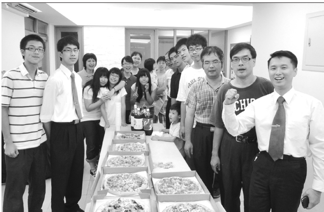
▲ 十七會所青少年及其服事者

經過最近一連串行動，高中生喜樂的相調在一起，無論來自何處或就讀甚麼學校，都單純的在主的話和主的靈裏相調，並且緊緊跟隨召會的行動和帶領。弟兄姊妹被話和靈充滿，也自然而然的在班上湧流生命。誠如詩篇一百三十三篇所言：『這好比那上好的油，澆在亞倫的頭上，流到鬍鬚，又流到他的衣襟；又好比黑門的甘露，降在錫安山；因為在那裏有耶和華所命定的福，就是永遠的生命。』願主傾倒屬天的祝福，將青年人建造在一起，使他們在各校園作耶穌的見證人。（傅振旗）