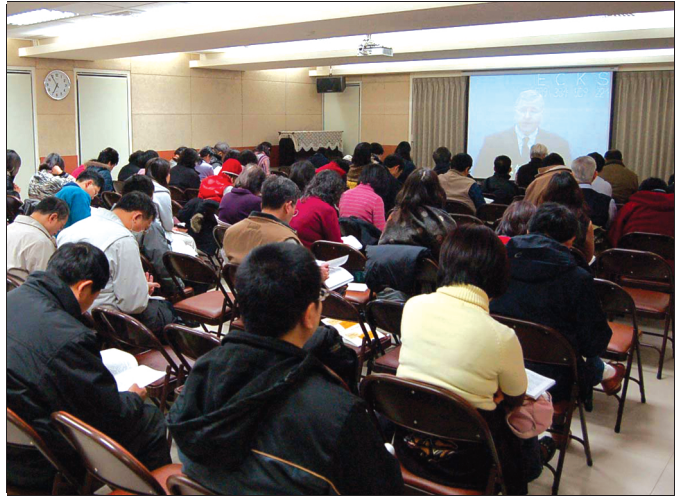
▲ 十二會所聖徒踴躍參加錄影訓練

弟兄們先帶領眾聖徒一同進入經文和綱要，在重點題示並鳥瞰之後，再看錄影，就更能進入真理的要點與信息的負擔。錄影播放結束後，每天由不同大區的聖徒分享。末了，負責話語的弟兄再有一些加強。此時天色已逐漸放明，弟兄姊妹陸續離去。週末則因放