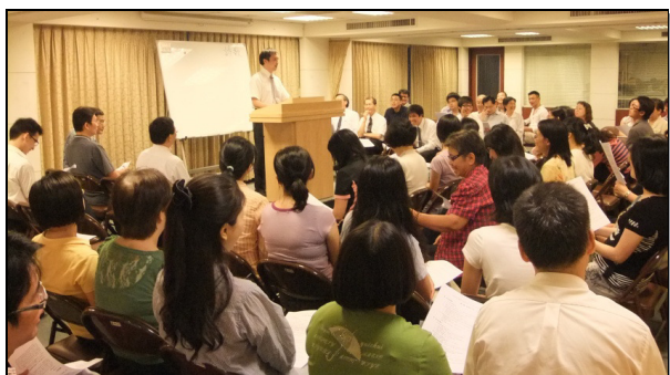
▲活力排成全聚會情形

為著召會的擴增與建造，並為使召會生活生活化，十五會所弟兄們決定自八月二十一日起，利用六個主日的晚上，舉辦活力排成全聚會。八月初全會所事奉相調中，弟兄們起來吹號，眾聖徒熱烈響應，已過兩次聚集都有近百位弟兄姊妹前來參加。