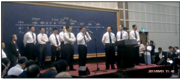
▲弟兄們在信息後作蒙恩見證

此次信息分作兩條線，上午聚會的主題是『主恢復歷史的回顧—在臺灣（一九八二年至一九九七年）』。八二至八九年李常受弟兄返台帶領新路的實行。當中，八六年開辦全時間訓練。八七年建立福、家、排、區