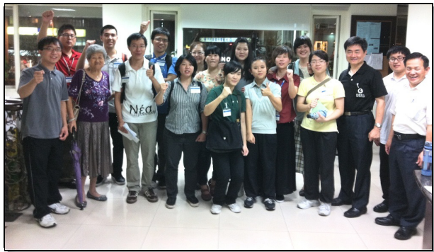
▲大專生和社區聖徒一同外出開展

這段時間，聖靈也在人裏面細細搜尋，分別平安之子。有一天，一組聖徒原本叩門都一無所獲，卻在收