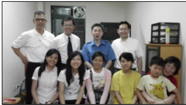
▲三十四會所聖徒至大學新生家中訪問

首先，藉著彙整各地召會考取的名單，社區弟兄姊妹在暑假期間就開始爲這些青年聖徒禱告，一同領受照顧他們的負擔。接著，主動與考上的新生聯絡，邀請他們參加畢業生愛筵、配搭兒童品格園，並參與大