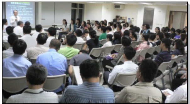
▲青少年服事者交通實況