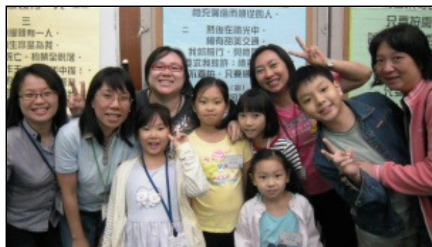
▲三十會所兒童及家長參加親子健康生活園

末了，服事的弟兄們題醒家長，回家後仍需實行家聚會，陪孩子晨興、晚禱。我們也將這次的性格負擔，帶進兒童排，讓更多的小朋友一同操練，將神人生活落實到每個家裏。（郝吳佳玲）