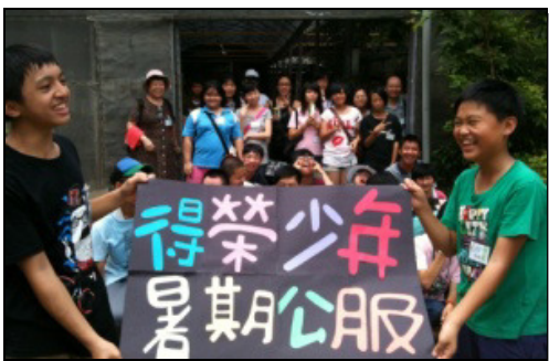
▲得榮少年暑期公服結束合影