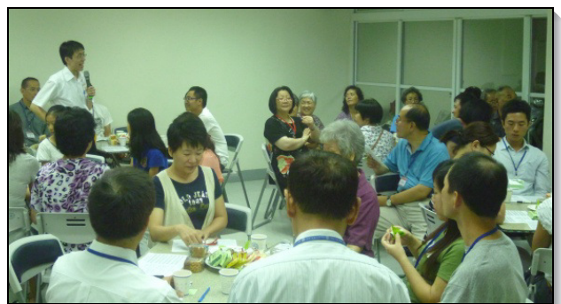
▲四十五會所聖徒實行月月傳福音

阿利路亞，傳福音該是我們基督徒的生活，也是我們頂要緊的工作。為此，四十五會所弟兄們帶領聖徒在實行上更往前，將已往一季一次的福音聚會，調整為每月舉行。並且若當次福音聚會受邀的朋友皆不克前來，聖徒們便外出到街上發放福音單張，邀請路上行人進來聽福音。