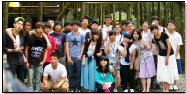
▲二十二會所學生區暑期外出相調

到了暑期，他們不只參加大專特會、現場訓練，服事者更鼓勵他們陪同高國中聖徒參加特會及中幹訓練，學習照顧、牧養小羊。此外，他們也有分於全台青少