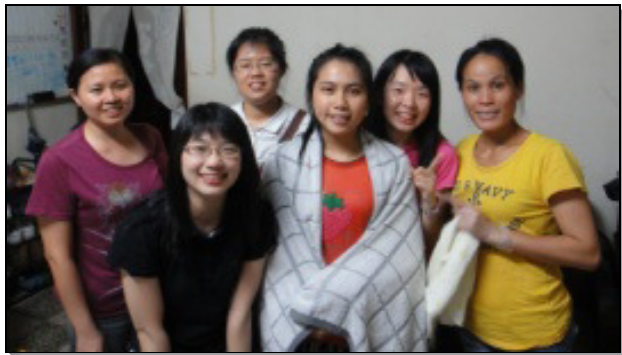
▲全時間訓練學員與新受浸姊妹合影

已過全時間訓練休訓期間，學員紛紛回到各地召會一同配搭服事。其中，有六位學員自七月三日起，與大甲和外埔聖徒配搭，在台中市外埔區有為期三十天的開展行動。弟兄姊妹每天三個時段，不畏風雨，堅定持續走出去，福音的火至今仍在焚燒。