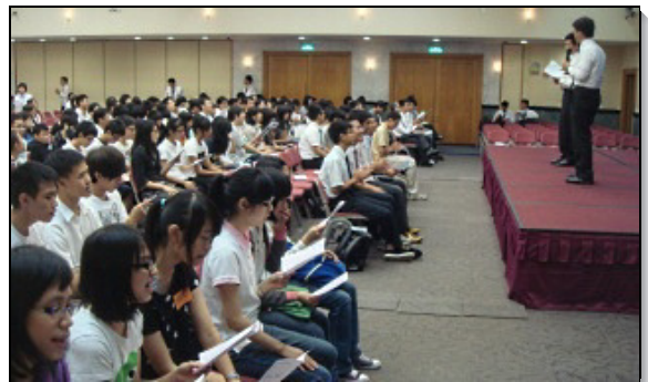
▲期初高中福音聚會實況

為使福音的火不僅在高中校園焚燒，也能帶進國中校園與社區，本召會將於十月二十九日下午三時，在一會所首次舉辦『國中福音大會』。懇請眾聖徒為福音的傳揚持續代禱，無論是高中或國中的弟兄姊妹，都能作神福音勤奮的祭司，將人當作祭物獻給神，使神得著喜悅與滿足！（張證豪）