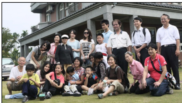
▲十七會所聖徒出外相調合影

此次相調也有剛畢業投入職場的青年聖徒參加。藉著一同出外，不僅增進了對他們的認識，也在交通中，將他們帶進了學生服事的配搭。十七會所周圍環繞多所高國中，除了有弟兄姊妹之家要照顧，還有校園排、飯食服事、社區青少年屬靈關懷、學業督促等需要。盼望有更多家能打開，和青年人一同扛抬約櫃。也願主藉著異象的更新、身體的聯結，把我們作成一個祭司體系，爲主得人得地！（林怡孜）