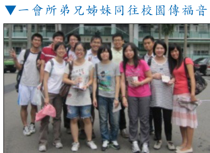
▼一會所弟兄姊妹同往校園傳福音