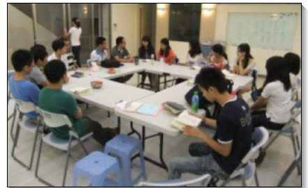
▲政大聖徒與福音朋友一同唱詩