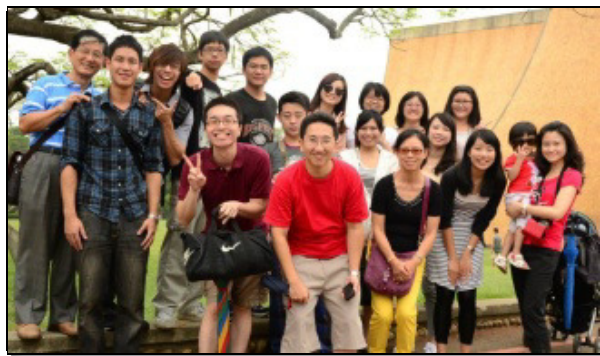
▲三十一會所聖徒於東海大學喜樂的相調

十月九日至十日，我們安排了二天一夜的台中相調。第一天到台中雖然是陰天，大家卻仍興緻高昂。晚上，我們挑選了一家餐廳享用晚餐，並有溫馨的聚集。有幾位弟兄姊妹，精心製作了召會生活剪影送給區裏的聖徒，其中有感謝、有鼓勵、有安慰，眾人都覺得被顧惜並得了溫暖。最後我們一起唱著詩歌『家』。歌詞中說到：『家是人安息的地方，避風港，在此扶持同成長，醫治愁苦憂傷。』弟兄姊妹雖然不是我們肉身的親人，卻比親人還親。而召會就是