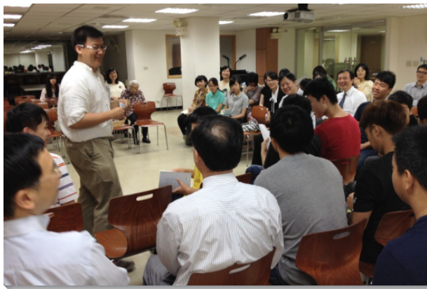
▲二十二會所舉辦畢業生聚會