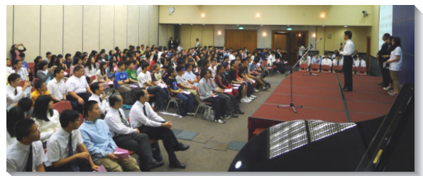
▲高中聖徒向與會同學分享見證

當日信息後，共有十二位高中生經過談話，受浸歸入主名。願主繼續祝福，在各校園、各社區，得著青年人，成為『生命奇蹟』的見證人。（郭詔中）