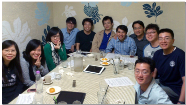
▲四十三會所聖徒一同享受小排聚會

而在『恢復召會生活的生態』方面，除了例常的晨興、禱告、相調，弟兄姊妹開始實行活力排，週週出