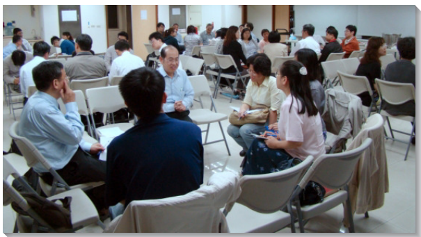
▲各領域職場排進行研討交通

職場排使在職聖徒能發揮召會生活所學一切，無論是福音的傳揚、真理的裝備、彼此的配搭等，都能在其中得著很好的操練及應用。我們當趁著還有今天，勞苦經營，將來必享受美好的生命果實。（黃昊威）