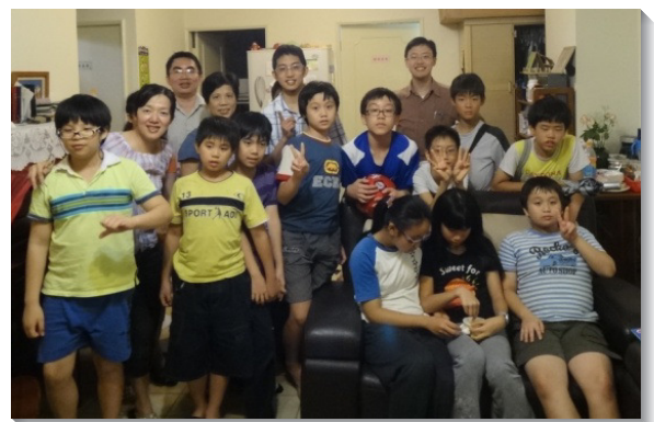
▲十六會所小六畢業生每週同聚小排

聚集內容是主題式的課程：『救恩之路』，一面使他們認識受浸的真理，一面也學習基本的屬靈操練，如：呼求主名、禱讀主話、禱告等等。我們盼望他們能清楚得救，也能對主有主觀的經歷。有一次我們和他們說到『奉獻』的主題。他們看見新生鐸夫的榜樣，他不羨慕地上的財物，反而甘心樂意將自己奉獻給主。又聽到主護村的弟兄姊妹，堅定持續為主在全地的開