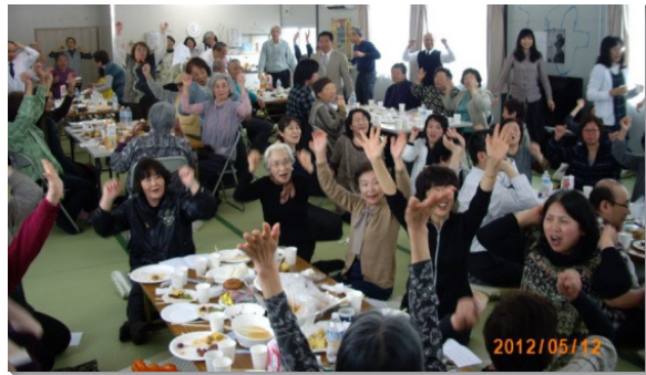
▲石卷市福音聚會，福音朋友大聲呼求主名

經過幾天的開展，弟兄姊妹有負擔在組合屋中借一個場地，舉辦一連三場的福音聚會。於是到了週六，有從仙台、美里來的聖徒，一同配搭傳福音、唱詩歌、作見證，甚至帶著全場的人一同釋放靈呼求主名。當天雖有許多人未曾聽過耶穌的名，卻願與我們一同唱詩，呼求；聚集中滿了喜樂的氣氛，甚至有福音朋友