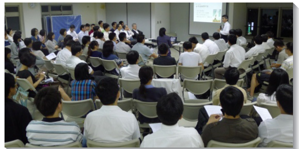
▲青少年服事者在四會所交通

各大區服事者接續分享實行上的蒙恩：一、服事者間有殷多並即時的交通；社區聖徒配搭校園排的服事。二、挑旺青少年福音的靈，成全他們在福音聚會中帶詩歌、作見證、講信息。會後陪同他們看望與會的同學家長，藉此得著同學也得著家長。三、規劃近程、