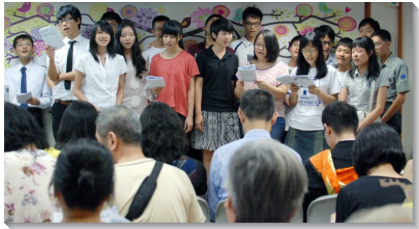
▲台大畢業聖徒唱詩展覽

六月九日中午，台大的畢業典禮結束後，十九會所聖徒為這些畢業生及他們的家人舉辦了一場畢業生愛筵聚會。當天午餐的菜餚由各區聖徒親自準備，豐富多樣，見證了神洋溢的恩典。