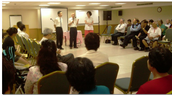
▲二十七會所福音聚會

的禱告。我們也需要在家庭生活中活出基督，藉著各樣的機會，運用從神來的智慧供應基督。對待家人也像照顧召會中的新人，不該操權管轄，倒要像奴僕，找機會服事他們。我們也要竭力維持同心合意、和諧一致的氣氛，就是最滋養人的生態環境，使家人樂意接受主。二十七會所弟兄姊妹的家族中有許多尚未得救的親人，他們是我們繼續努力的目標。