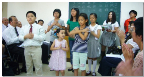
▲二十一會所兒童唱詩展覽

同時，全時間學員也在今年三月來到南港地區有分福音開展。為了接觸家長，我們另成立了一個以操練性格為主題的兒童排。藉此，當學員在五月結束開展