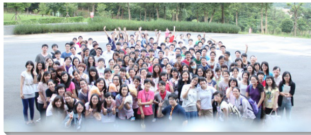
▲中區及南二區大學聖徒甜美的相調

之金燈台的實際』。一開始，有些新蒙恩和剛從高中畢業的弟兄姊妹反應內容太深奧，無法進入。然而藉著禱告服事他們，在特會末了，他們自己見證，當他們用靈進入這些話時，主就向他們說話，使他們摸著主的心意，主的話也深刻的留在他們裏面。