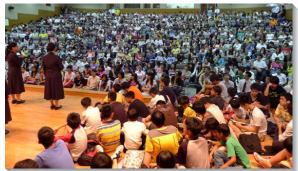
▲高國中生聆聽學員參訓見證

第三天主日，眾人在高昂的靈中向主讚美，並在各會所服事者鼓勵的話中畫下句點。盼望每位青少年在平日的生活中繼續操練，定大志，設大謀，向主奉獻，討主喜悅。 (葉飛隆、蔡蕙如)