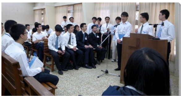
▲大學聖徒於特會信息後申言分享

召會就是今天的新耶路撒冷，而新耶路撒冷乃是宇宙的金燈台！我們願意為著身體的需要被鎚打在一起，成為團體的新耶路撒冷。我們也願意藉著七盞火燈的焚燒，今日在台灣學習栽種召會樹，將來到各地建立金燈台！ (李杭峰)