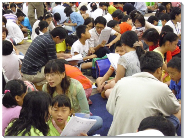
▲家長與孩子一同進入信息內容