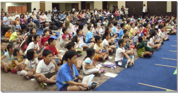
▲兒童們排隊準備開始活動

本 召會暑期親子健康生活園於八月二十至二十五日，分兩梯次在中部相調中心舉行，每梯次各三天兩夜。此次參加者包括兒童、家長、服事者和隊輔，兩梯次合計八百八十八位；當中包括一些海外聖徒，日本的弟兄姊妹更組了兩隊，與我們在一個新人裏有相調。此次生活園主題是性格：苦、低、貧。『苦』即不怕苦、肯吃苦；『低』即心低微、居低位；『貧』即靈貧窮、心樂貧。眾人一同操練『與主同苦學順從，受苦心志為兵器』、『謙卑低微常服事，自居低位不驕傲』、『靈裏貧窮享受神，心中樂貧肯給人』。