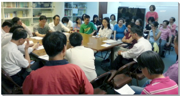
▲十五會所兒童排檢討與展望交通

今年初，十五會所開始推動『區區要有兒童排』的負擔。目前，兒童排從原有兩個排增為五個，兒童人數從十餘位擴增至三十餘位，配搭的聖徒也已超過三十位。為著在服事上更往前，已過八月二十六日晚上，眾人在會所一同有檢討與展望交通。