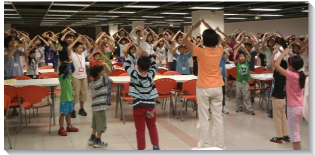
▲親子健康生活園詩歌歡唱

本 召會暑期親子健康生活園於八月二十至二十五日，分兩梯次在中部相調中心舉行，每梯次各三天兩夜。此次參加者包括兒童、家長、服事者和隊輔，兩梯次合計八百八十八位；當中包括一些海外聖徒，日本的弟兄姊妹更組了兩隊，與我們在一個新人裏有相調。此次生活園主題是性格：苦、低、貧。『苦』即不怕苦、肯吃苦；『低』即心低微、居低位；『貧』即靈貧窮、心樂貧。眾人一同操練『與主同苦學順從，受苦心志為兵器』、『謙卑低微常服事，自居低位不驕傲』、『靈裏貧窮享受神，心中樂貧肯給人』。