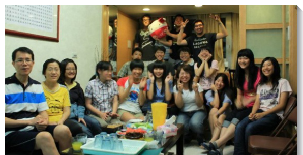
▲三十二會所大專小排

這樣『把小排作到家』的實行，使學生們得以更認識彼此，與家長的距離也更拉近。此外最重要的是，每次小排聚集都成了傳福音的好機會！（戴天楷）