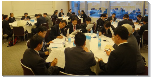
▲弟兄們分組研討信息

主恢復中獨一的工作就是神的工作；神要在基督裏把祂自己作到我們裏面，使我們與祂成爲一。主耶穌在人性生活與地上職事裏的工作，是我們的榜樣。使徒行傳揭示，這工作是在升天裏，憑著那靈，並在神聖水流裏的工作。有分於這工作的人，乃是基督的大使，盡和好的職事，憑適應一切的生命作神的同工。在神的工作中，不能有干犯聖所的罪孽，要用金、銀、寶石來建造。此外，我們需要持守安息日的原則，不能只有事奉殿的事奉，而要侍立主前事奉祂，享受祂作隱藏的嗎哪、發芽的杖、與生命的律。我們作職事的工作，建造基督的身體，需要達到信仰上並對神兒子之完全認識上的一，達到長成的人，達到基督豐滿之身材的