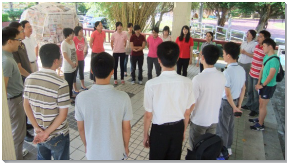
▲弟兄姊妹於接觸人之前一同禱告

這兩週的早晨，我們除了一同複習特會信息，也追求『活力排的訓練與實行』一書，豫備在本學期落實