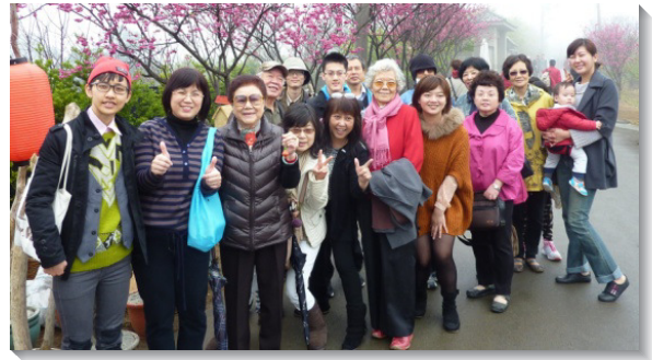
▲三十五會所年長聖徒上陽明山相調

或體力構不上，平日少有機會出外接觸大自然。在外出時，服事弟兄姊妹貼心的接送、攙扶，安全又可靠，得著扶持之餘，聖徒們也享受了踏青的樂趣。