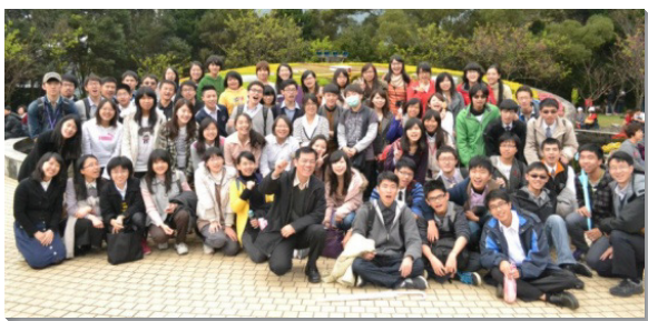
▲南一大區大學聖徒期初特會於陽明山舉行

一、月二十三至二十四日是南一大區的大學期初特 二、會。弟兄姊妹前往陽明山嶺頭山莊，展開喜樂的相調；參加的有台大、師大、北教大、及台科大的學生聖徒，共八十多位。這次特會主要的負擔是調進新人，並使每個人找到同伴，一同成為活力人，作生死夥伴，在各個校園與主的行動配合。