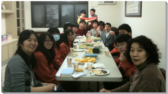
▲二十八會所南湖高中小排

在聖徒們的交通、禱告與尋求中，我們看見經營這個高中排，在福音工作上是有大益處。一方面，在排裏，校園中互不認識的學生聖徒能被聯結在一起；他