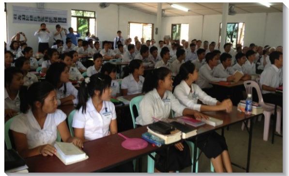
▲仰光訓練中心上課情景

特會中也有在各地開展的弟兄，交通亞洲十五個國家的開展現況，包括：孟加拉、柬埔寨、海灣六國、印度、寮國、緬甸、巴基斯坦、斯里蘭卡、越南以及北賽普勒斯。各國的交通使眾人大得激勵，看見主的確給了祂的恢復一個敞開的門，是無人能關的。幾處地方的弟兄們也特別交通到，需要有更多說華語的弟兄姊妹到這些國家去開展，因為這些國家歡迎華人。例如在埃及這樣以回教為主的國家，有許多回教徒因為想學中文，而願意與弟兄姊妹有交流，這就使弟兄姊妹有機會能向他們供應主的話語。