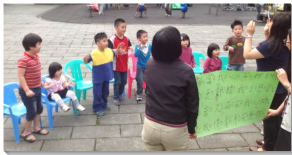
▲錦安公園兒童排兒童歡樂唱詩

角色，帶領福音小朋友唱唱跳跳。我們也盼望藉此培養孩子對人有負擔，將來能成為結實有用的人，看見人的一生不應只在世界裏忙碌，更要贖回光陰在主裏忙碌！