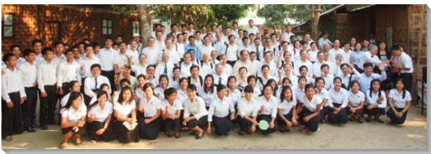
▲仰光訓練學員與參加 LMA 之聖徒合影

年兩次的『主在亞洲的行動』特會，每年固定在春、秋兩季舉行。今年春季的特會於四月二十三至二十五日在緬甸仰光舉行，與會的有八十六位來自十五個國家的海外聖徒，以及四十位緬甸本地的弟兄。此次特會總題為『世界終極的局勢、主恢復終極的行動與我們終極的責任』，共分為七篇信息。釋放信息的弟兄們有很重的負擔，盼望眾人能看見我們是在『終極』的時代，必須認清世界局勢的發展，主恢復的行動，以及我們該如何與主有強的配合。從一九二二年算起，主的恢復已經經過了三個三十年，在每一個三十年間主都有祂特別的行動。在我們邁入下一個三十年，也可能是終極的三十年時，更需要藉著認識世界終極的局勢，來思考主現今要我們作甚麼。眾聖徒在特會中受到題醒，在主終極的恢復裏，我們終極的責任乃是活基督，並在我們的所在地，以一種方式一同聚集，使我們能成為基督的身體、新人、燈台和新婦。主恢復的開展也必須是我們終極責任的一部分。我們都需要接受託付，將國度福音的真理傳佈到整個居人之地。