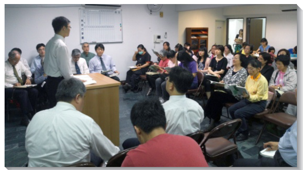
▲聖徒們在四十六會所聚集

為了尋覓合式的聚會場所，這二年半來，服事弟兄們看了三十多處地點，仍遲遲無法找到理想的地方，只得先借用九會所二樓為例會場地。雖然如此，聖徒卻未因沮喪而停止禱告，反而抓住主的應許，迫切向主祈求。過程中，主持續把新人加給我們，也尋回許多久未聚會的聖徒；因為人數不斷增加，弟兄姊妹也更加同心，朝共同的目標前進。終於，藉著與身體的交通，我們租下了一處場地，掛上招牌，於上月二十八日開始在該處有聚集。我們也求主繼續帶領，使我們能購得合式的場地作為會所。