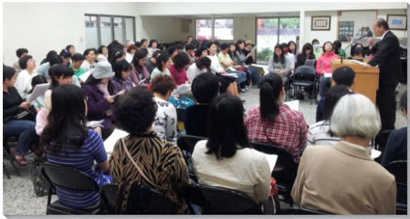
▲十會所姊妹成全聚會

已過三、四月，藉著舉辦全會所區負責弟兄成全聚會，加上推動晨興的實行，十會所人數有些增長。值此復興的關鍵時刻，弟兄們希望姊妹們亦能擺上自己的那一分，同有配搭。終於，睽違多時的『姊妹成全聚會』在四月二十八日恢復了。當天雖然傾盆大雨，仍有近八十位姊妹領受負擔，喜樂前來，盼望