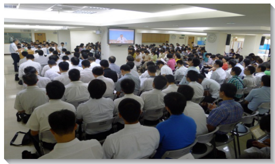
▲眾人聆聽會中交通