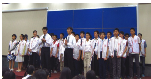
▲弟兄姊妹於青少年福音聚會中展覽