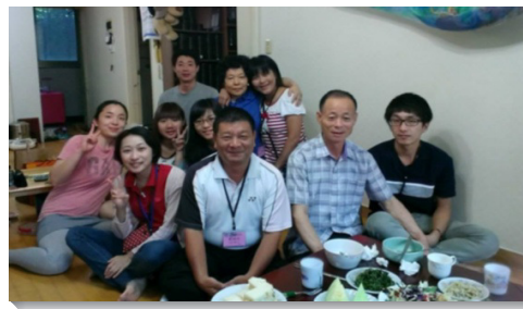
▲弟兄姊妹接待在聖徒家中

另一組前往日本神戶召會，當晚便與當地聖徒聚集，負責弟兄向我們交通召會近年繁增的情形，他們突破