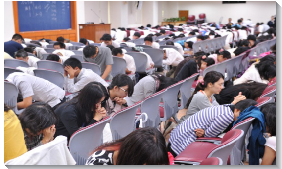
▲在一會所會場信息結束後個人禱告

弟兄們請有心願參加全時間訓練的聖徒上台奉獻時，台上、台下排滿人，必須延長聚會時間，纔能讓他們一一宣告。眾人同證：奉獻愛主，何其榮耀。弟兄們一面看見聖靈的帶領，讓青職聖徒有機會宣告奉獻，一面也注意到要持續走奉獻的路，落實奉獻的心願，例如在職場表明身分、主動向同事傳福音、分別固定時間叩訪、邀人參加召會聚會、實行活力小組，被成全也成全人等，這些具體操練的路。