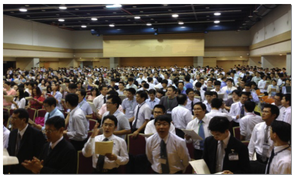
▲於養生村會場聚集唱詩

在長庚養生村聚集的聖徒，主要來自台北市和新北市召會，共一千一百五十一位。第一堂聚會開始，弟兄們就挑旺眾人的靈，請小組長領頭奉獻；隨著信息負擔逐一釋放，弟兄姊妹靈裏奉獻的火一路焚燒。當