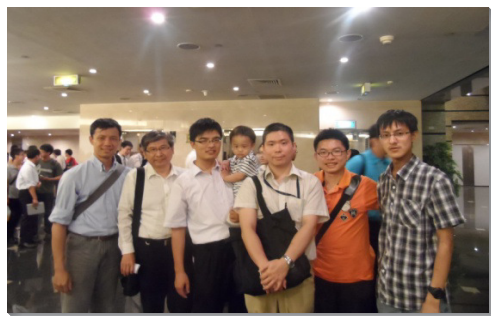
▲弟兄小組長於豫備聚會後合影

本次全台青職特會，八會所共有十二位青職聖徒參加，特會結束後，適逢八會所與四十七會所集中主日