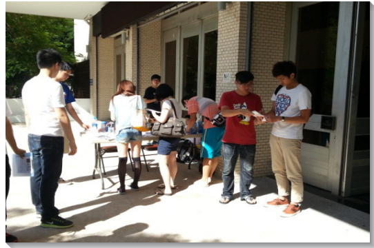
▲把握新生體檢的機會接觸新生

彼此代禱，藉著堅定持續到宿舍陪晨興，將校園中的姊妹與我們調在一起，一位大一姊妹因此得穩固參加主日聚會。一位原先受照顧的姊妹，也在小組的配搭裏，將室友帶得救，她的召會生活因此益加穩固。隔週連假期間，姊妹們約新人和福音朋友到聖徒家中聚集，或傳福音、或作見證、或鼓勵受浸，人人都盡功用，開家的聖徒更適時供應，補上學生的不足，與會的福音朋友便受浸得救。翌週，一位得救僅半年的姊妹，母親因事北上，她邀母親在姊妹之家同住，也一同參加聚集，主日聚會後，母親便受浸得救。何榮耀，這樣的生活，使我們常常結新果。