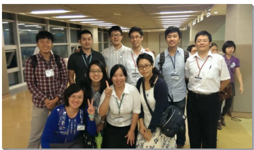
▲參加大學期初特會合影

已過九月福音節期，三十九會所也豫備一系列福音行動，例如期初愛筵交通、週末新生福音，學生們每場都邀約同學參加，其中有四人受浸得救，成為常存的果子。我們隨後也安排新生命之旅，盼望帶新人操練屬靈基本功課，並調進召會生活。我們確信主要持續祝福祂的工作，成全青年人，成為迎接主回來的一代。 （高新綸）