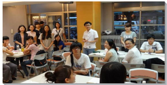
▲邀約同學朋友來會所聽福音

這些得救的弟兄姊妹，多表示曾接觸過福音和召會，誠如約翰福音四章三十七至三十八節所說：『那人撒種，這人收割，這話可見是真的。我差你們去收你們所沒有勞苦的，別人勞苦，你們享受他們所勞苦的』。人能穀相信是在於聽，而人能穀聽見，就需要我們去傳揚。這使我們得鼓勵，我們所分別出來傳福音的時間，即便只有半小時、一小時，就有機會將生命的種子撒進人裏面，帶人認識主，因此我們不該埋藏自己的一他連得銀子，應隨即拿去作買賣，如此我們的造就喜悅。 （林意真）