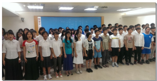
▲南二區青少年練唱大會主題詩歌

南二區的服事者們常有禱告與交通，安排各項事奉，配搭中顯出同心合意，滿了一的見證。許多青少年因著操練擔任小組長的服事，啓發出福音的負擔和服事的心願，盼望他們在校園中成為耶穌的見證。藉著這次大會，願主興起少年人，被基督充滿而有活力、有盼望。（呂杰昭）