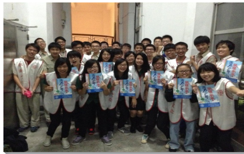
▲外校聖徒赴建中協助邀約同學赴會

盼望青少年聖徒藉著這段操練傳福音的過程，對人產生關切和負擔，能以擔負終極的責任，應付主在終極時代的需要。（賴中仁）