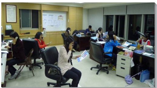
▲中區青少年和服事者電訪邀約

還有些會所的服事者請擔任小組長的學生，於課後至會所用餐，餐後一同禱告，打電話邀約同學，有位學生見證，當晚就有兩位同學答應參加。此外，我們也鼓勵青少年家長幫忙邀約，有位家長認真邀約，已有三人答應赴會。願藉著此次大會，啓發聖徒生機的功用，讓更多聖徒關心青少年。（蘇正茂）