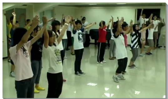
▲東區青少年練習大會健康操