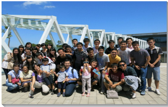
▲學生與照顧學生的家庭外出相調

研究社借用學校場地舉辦福音講座，主題為『彩繪你的人生』。與會者超過九十位，其中有些是在社團聯展時得知訊息而主動出席的。福音信息兼具知性、理性，帶著生命的供應，激起許多同學對聖經和基督徒信仰的興趣，會後便有一位同學受浸，並有多人願意讀經，建立起多個讀經小組。