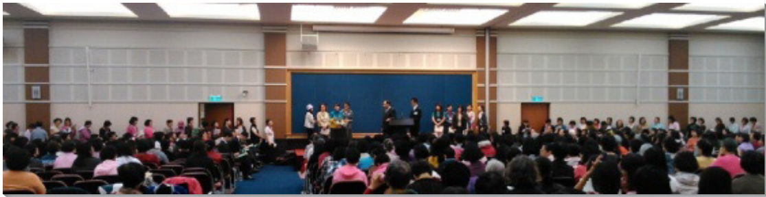
▲姊妹們踴躍分享之盛況

許多年長，或者帶著孩子的姊妹，雖然有諸多不便，但仍竭力進入主今時代的說話。主話的亮光豐富，向眾人傾倒，每到上台分享的時刻，姊妹們申言情況踴躍，無須催促指派。會後的用餐時間，雖然人數眾多，卻是有次有序，在靈裏接受服事的安排，實在是因主話的供應，將眾人帶到基督的元首權柄之下，以基督作人位。 (本刊整理報導)