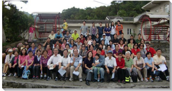
▲聖徒於福隆相調合影

午餐後，我們集合唱詩『在召會生活裏』，詩歌說出在召會生活裏有神的同在、神的說話和神的權柄，真理亮光、生命喜樂，耶和華所命定的福都在這裏。