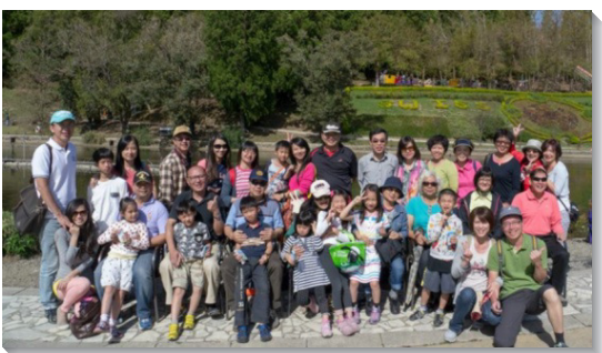
▲小排生活中，聖徒外出相調合影

全時間訓練學員配搭開展，每週三、四出外叩訪、看望，恢復召會生活『福』的架構。探訪的行動使年長聖徒得顧惜，許多久不聚會的弟兄姊妹心被溫暖，被帶回神家，還得著一些渴慕主的福音朋友，眾人都得激勵。