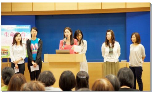
▲三會所聖徒分享服事蒙恩

本學期各校大學生命教育服務社共有四十位新血加入，已過一年，有一百一十四人次投入三十六個班級，擔任生命教育志工服務，成效卓越。同時，還有許多大學生在『快樂學習，才能發展』教育專案中擔任輔導員。關懷一些失去學習動機的青少年，引導他們適性發展，並重回學業正軌。暑假期間，五所大學生命教育服務社聯合舉辦花蓮原住民生命教育營隊，將他們所享受的生命豐富，分享給原住民的青少年。願主記念每一個撒下的生命種子，都能生長結實。 (葛孟禹)