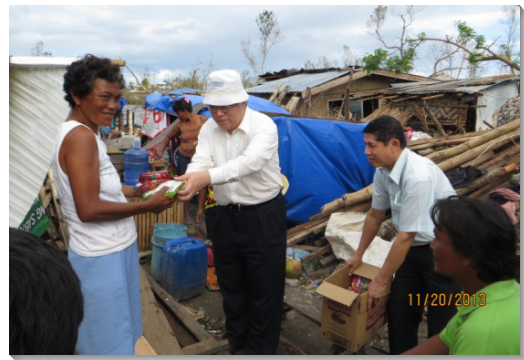
▲弟兄們致贈物資與災區聖徒