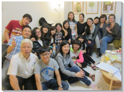
▲學生在聖徒家中喜樂聚集