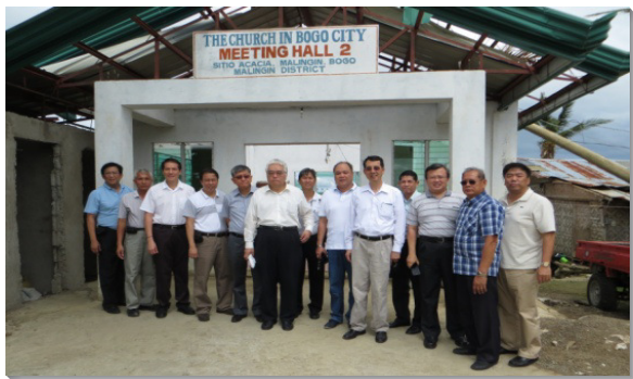
▲弟兄們至災區召會探訪

次日，弟兄們分批至各受災區訪問，包括宿霧北部Bogo、Daanbantayan、Medellin、San Remigio等地，沿途所見農作物全倒、樹木摧折，絕大多數房子受損。我們逐一前往受災聖徒家中致贈食物，並表同情。當他們看見台灣和菲律賓同工們前來探訪，知道海外的聖徒們都與他們站在一起，心裏甚是感動，臉上充滿喜樂。當晚弟兄們繼續和宿霧服事的聖徒們交通，使眾人認識這是場屬靈爭戰，當穿起神全副的軍裝。聖徒們也表示，此刻同工們來訪，在屬靈和物質上都帶給他們適時幫助。最後一日早晨，弟兄們回宿霧會所，