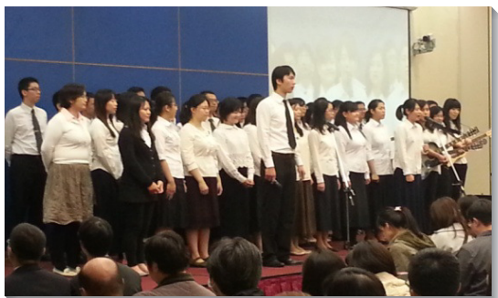
▲南一區青職聖徒展覽詩歌

十一月二十三日於信基大樓和一會所，分別舉辦青職福音聚會，主題為『人真實的需要』。信基大樓場次與會人數約九百五十位，會後有十八位福音朋友受浸歸入主名；一會所場次與會人數約五百五十位，九位福音朋友受浸。