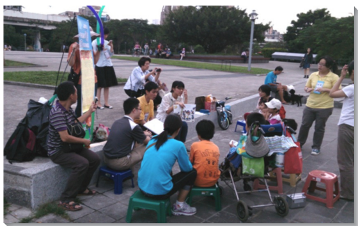
▲華山公園戶外兒童排

首先，關於青少年的服事，八月底開學期間，青少年家長暨服事者一齊愛筵交通，眾人同領受負擔。於是，由二個青少年的家，協同十餘位青職聖徒，建立