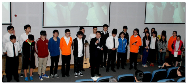
▲北科學生於成立聚會時展覽

上半年，六位全時間訓練學員組成開展隊，前來與聖徒配搭。學員們白天在北科校園開展，晚上則到社區叩門。事實上，中區各會所的弟兄姊妹，都是開展隊的