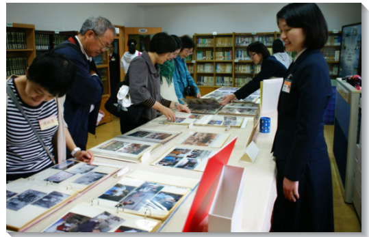
▲學員家長參觀訓練生活靜態展

會後，有三位家屬受浸得救，其中還有一位是原本反對女兒報名參訓的父親。讚美主，相信祂要繼續藉著這個訓練，成全這一代的青年人，棄絕世界，盡心盡性愛主、事主，儆醒等候主臨。（葛新路）