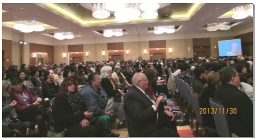
▲眾人在會中享受信息的供應

第一篇信息說到，約翰修補職事的內在元素乃是生命。說出今日建造召會的中心需要，是生命的修補職事。這職事要恢復破損之屬靈的網，並使信徒經歷基督