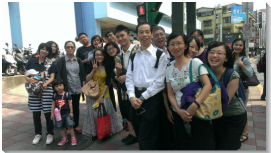
▲弟兄姊妹們喜樂合影

接著，眾人陸續分享近日個人或團體對基督的經歷。一位十天前纔受浸得救的弟兄，分享他如何在生活中主觀的經歷神；還有一位福音朋友，穩定參加小排和主日聚會，他們的見證鮮活，使眾人不禁讚美主的奇妙作為。更有一對開家服事青職的夫婦，分享他們在服事過程中如何得主加力。交通中，眾人再肯定青職服事的價值與異象。