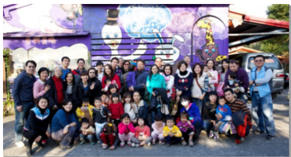
▲親子排中兒童及家長至宜蘭相調

五會所聖徒自去年起，推動各區成立青職排，其中第二區因有較多帶著幼兒的青職聖徒，自然形成『親子排』。剛開始時，有三個家、六至七位兒童固定參加。聚集前半段是唱詩歌及說故事的時間；後半段讓孩子進行勞作或音樂活動，而家長們則一同追求