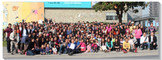
▲聖徒外出相調，彼此聯結同歡樂

展望新的一年，我們更要與同伴一齊操練過活力生活，投入召會事奉，建造基督的身體。（梁鐵民）