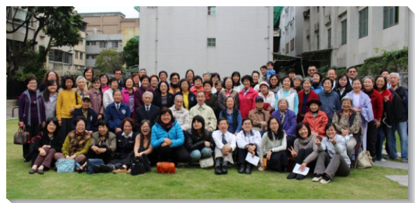
▲參加成全聚集的聖徒們

成全聚集中話語供應豐富，帶我們認識信徒一生經歷的藍圖。我們因著信，蒙神揀選，有分於亞伯拉罕的經歷，進而享受以撒的經歷，享受神為我們豫備的一切。然而，為使生命成熟，我們還需要再往前經歷