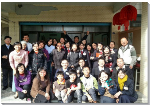
▲學員們與當地聖徒合影

開展至今，已有七十一位平安之子受浸歸入主名。我們願意繼續與基督天上的戰事合作，興起田尾的金燈台，在這地發光照耀。 (汪長威)