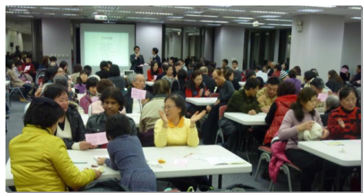
▲聖徒在數算主恩聚會中歡唱詩歌