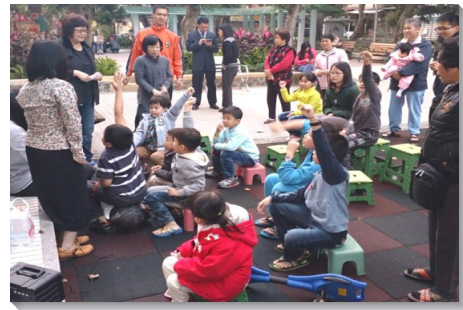
▲聖徒服事公園兒童排，孩子們熱烈回應

這段期間以來，弟兄姊妹們同心合意的配搭和堅定持續的實行，帶進三項蒙恩的結果：第一，更多聖徒配搭盡功用。區裏有三分之一的聖徒都同來配搭服事，特別有幾位青職聖徒因而擔起服事的責任。第二，廣傳福音。弟兄姊妹們利用兒童排的時間，在公園裏接觸兒童