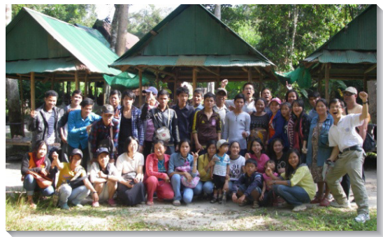
▲學員和聖徒帶新人外出相調

暹粒召會仍需我們的禱告，求主為他們豫備合式的會所，並成立弟兄姊妹之家，培育更多青年人，成為合用的器皿，為著祂的見證。 (王馥陞)