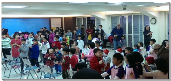
▲聚會中，孩童們歡唱詩歌

去 年底，五、七和四十一會所共有七十六位兒童和四十多位家長歡樂聚集，盼望藉此機會，得著我們身邊一個個福音朋友的家，將生命的種子撒進他們心裏。