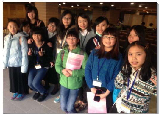
▲青少年姊妹們一同參加特會後合影