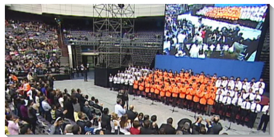
▲青少年及大學聖徒展覽詩歌