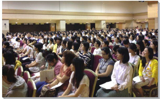
▲青職聖徒認真進入信息

會中，弟兄們開啓我們，看見神在這宇宙中只作一件事，就是建造祂永遠的居所。基督乃是神家的實際，我們要認識、經歷、享受祂，並將自己交給祂，使祂能完全以祂自己頂替我們，將我們帶進神家的實際裏，成就祂永遠的定旨。為此，我們需要恢復祭壇這真實的奉