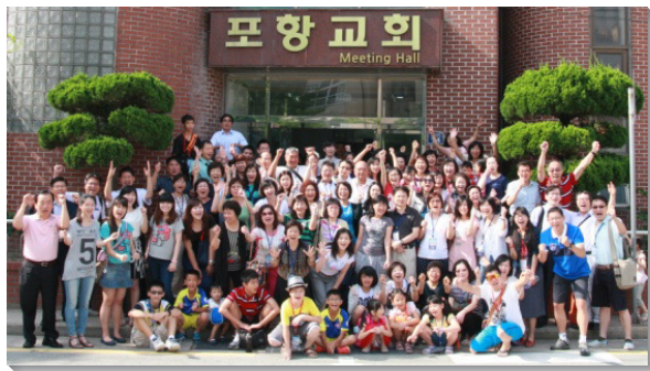
▲與韓國聖徒相調合影