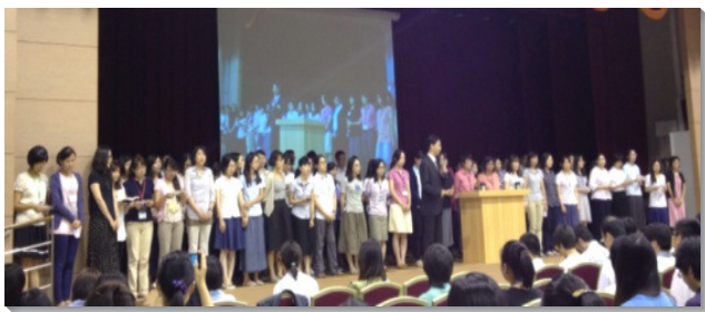
▲宣告奉獻參訓的聖徒站滿講台

特會共有十四篇信息。每天早晨第一堂聚會，弟兄們帶領眾人運用靈，認識調和的靈，並操練禱讀主話和禱告，建立享受主話的生活。接著，信息說到『全然奉獻』、『神的夢—永遠的伯特利』、『恢復祭壇，為著神家的建造』、『建立與神與人活力的關係』、『被真理構成並推廣真理』、『照著山上的樣式』、『西布倫哪，你出外可以歡喜』、『約瑟是多結果子的樹枝』、『成全柱子使主的恢復得以擴展』。每篇信息後，安排弟兄姊妹分小組交通禱告，另有四次分組聚會時間，同會所或大區的聖徒得以規畫共同的行動。弟兄們每交通一項負擔，如晨興、讀經、叩訪等，聖徒們立即可以與同組的同伴相約，訂定實行的目標和方式。弟兄更題醒眾人，特會後第一週是關鍵時期，