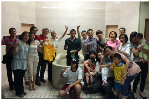
▲聖徒傳福音領人歸主，一同歡呼喜樂

去年至今，二十四會所聖徒響應『新人得一萬』的負擔，週週出外傳福音，已帶領七十九位朋友受