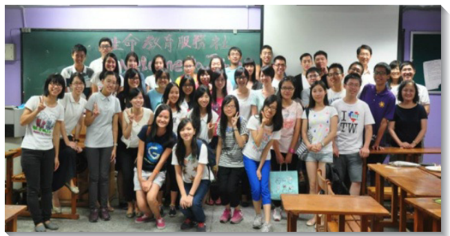
▲台師大生命教育服務社弟兄姊妹合影