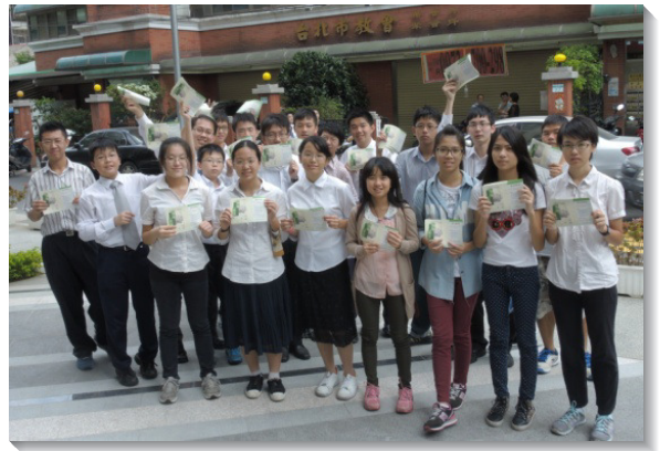
▲青少年弟兄姊妹們配搭外出叩訪