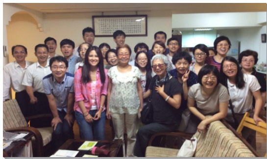
▲聖徒舉辦福音聚會，領人得救並餵養新人

如有一次，我們接觸到一位外地大學生，將名單轉交至花蓮召會後，該位學生不久後就受浸歸入主名。眾人都得鼓勵，為著基督身體得著擴增而讚美主。