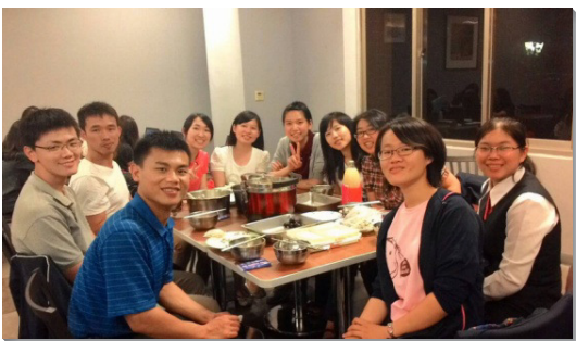
▲聖徒邀請新人與福音朋友至家中聚會

我們因著有分身體的行動，領受了主的祝福。一位聖徒見證，雖然下班回來身心俱疲，但他實在不願失去蒙恩的機會。藉著外出前與同伴釋放靈禱告，他再被主充滿。一次叩門的時候，他與同伴發福音單張，帶領了一