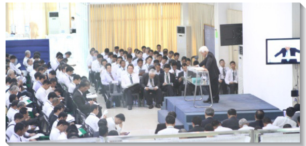
▲與會聖徒接受信息的傳輸

主在亞洲的行動是快速的，近幾年新開展的十六個國家中，已有三百一十五處召會，超過一萬六千位聖徒。除了傳揚國度福音外，牧養及文字工作的需要都是大的。求主興起更多的弟兄姊妹，為著主終極的行動，在主的禱告中禱告，在主的去裏去，並在主的給裏給，使主的話在亞洲各地強有力的擴長並得勝。（陳黃昱文）