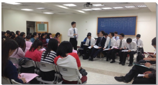
▲各校聖徒聚集，炭火彼此堆加