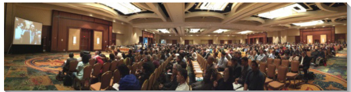
▲美國感恩節特會於德州聖安東尼舉行