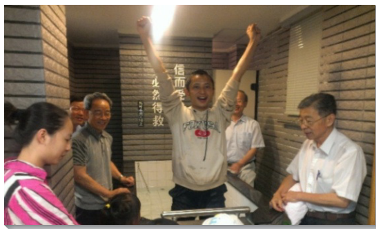
▲聖徒喜樂領人受浸歸主

青職弟兄姊妹也一同配搭，舉辦福音聚會，操練傳講真理。在配搭的服事中，如同詩篇第一百三十三篇所說，弟兄和睦同居，是何等的善，何等的美。願召會蒙主的祝福，得著建造，顯出榮美的光景。（陳必智）