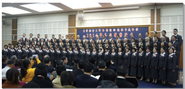
▲畢業學員展覽詩歌