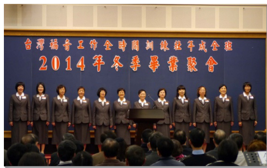
▲畢業學員分享蒙恩並宣告奉獻

之人為榜樣，澆奠自己的心志；並願常受題醒活在靈中，使主神聖的屬性得以彰顯在人性的美德裏，一生隨主腳蹤。末了更邀請眾人同唱，唱出對主回來之殷切渴望，讚美祂得勝為王。