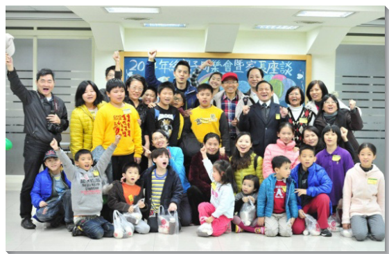
▲ 聖徒與福音朋友合影