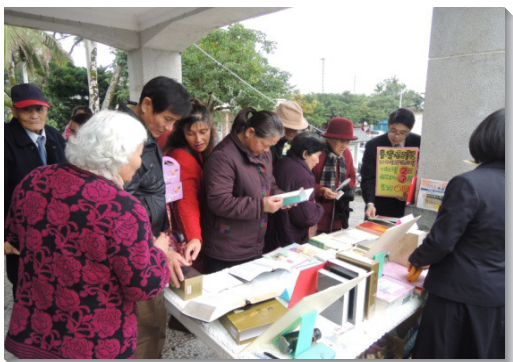
▲學員在堂會外設攤推廣書報

與往年不同的是，學員們不僅推廣書報，也帶著『全台新人得一萬』的負擔，全力配合各地召會的福音行動，與聖徒配搭，在車站、校園、大街小巷、人群聚集處傳揚福音。在這十天裏，學員與聖徒總共帶領八十二位朋友受浸歸主。基督榮耀福音的光照，隨著學員們的腳蹤，照亮一個又一個尋求者。