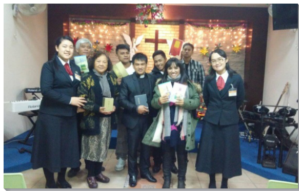
▲學員拜訪堂會，將書報豐富介紹給信徒

台北推廣隊的學員進入總統府和外交部，向團契成員供應主話的亮光和生命。桃園隊學員拜訪平地和山地的原住民基督徒團體，與當地牧師分享恢復本聖經中的註解。當主的話一解開，便發出亮光，許多牧師向職事的話語敞開，願意讓學員擺設書攤，直接和當地信徒推廣書報。新竹隊學員在召會聚會中呼召聖徒有分推廣行動，共有三十餘位青職及學生聖徒參與配搭。藉著簡短的訓練，眾人同心合意，得著加強，甚至能穀一天應付十四間會堂的邀請，前往推廣設攤，配搭的聖徒十分喜樂，並得成全。