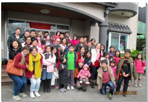
▲聖徒邀約福音朋友全家出外相調

感謝主，因著弟兄姊妹和睦同居，讓人看見我們中間有神的同在，也摸著神的愛。求主激勵我們，繼續剛強開拓，忠信殷勤傳揚福音、牧養聖徒。（魏林麗娟）