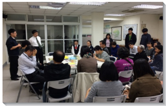
▲聖徒聚集唱詩、禱告後外出叩訪

今年我們願繼續與主是一，藉著『去』，使萬民作主的門徒。盼望每週有三分之一以上的聖徒配搭叩訪，並盡生機牧養的功用，照顧初信者。（黃昊威）