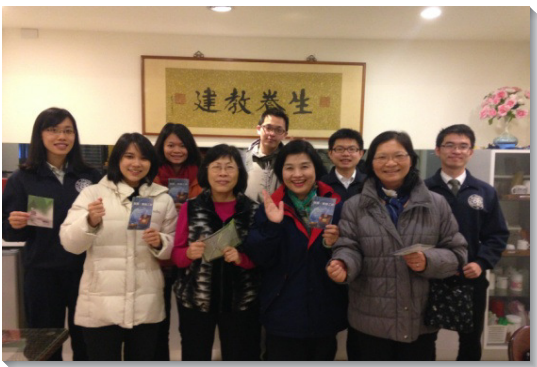
▲學員與聖徒配搭出外開展

負擔，積極傳福音，但將近年底時，開展遇到瓶頸，未能突破。弟兄們便交通，期末最後四週，請所有在南一區各會所配搭的學員，每週三都到八會所加強開展，作同去爭戰的『迦得』。