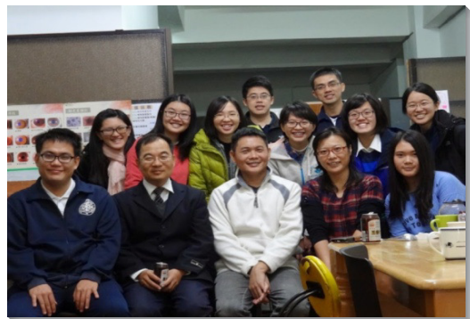
▲學員與聖徒在初信者家中聚會

讚美主，在基督身體的配搭中，與眾聖徒同魂與福音的信仰一起努力，開拓主的見證。（黃上蘋）