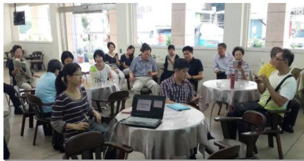
▲聖徒們接受福音成全訓練

許多聖徒見證，藉著成全訓練，他們得著加強，放膽接觸人，也能彀清楚的向人講說福音。當福音朋友面臨受浸的關時，他們也學習照著主確定的話，陳明真理的話，並運用權柄吩咐人受浸。一位年長聖徒分