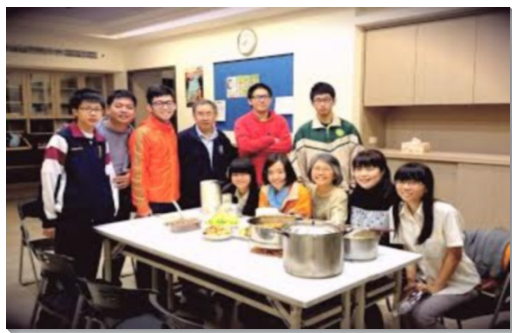
▲學生聖徒在會所參加小排聚集

去年底年終數算主恩聚會時，有六位同學受邀前來參加。他們在會中分享，從與聖徒的互動中，感受到神的愛以及召會的關懷，讓他們很受感動，進而認識基督徒的生命確實與眾不同。他們也願意繼續接觸聖徒，繼續來到召會中，進一步認識主耶穌的愛。我們願意堅定持續禱告，以生命和真理服事學生，得著青年人。盼望今年在育成高中、南港高中、南港高工等三所校園更多勞苦。 (林震)