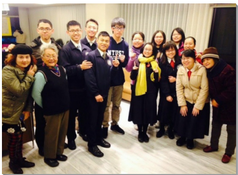
▲學員與聖徒配搭，領人歸主