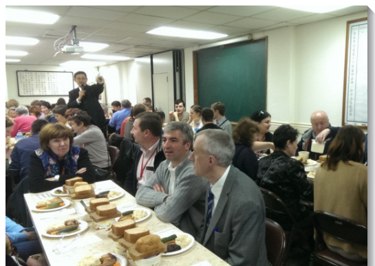
▲聖徒精心豫備愛筵，與海外聖徒交通

許多海外聖徒邀請尚未得救的家人一同前來，在特會與訪問召會期間，榮耀的神向他們顯現，其中有三位呼求主名，歡歡喜喜的受浸。在接待的過程中，聖徒們都被喜樂與聖靈充滿。求主擴大我們，日後能敬接待更多聖徒。（曾之尋、張雯琳）