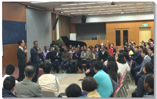
▲與衣索比亞的聖徒相調聚集

會前，各地召會負責弟兄們豫知將有大規模的接待，多次與聖徒交通服事的原則，盼望接待的服事能彀作得屬靈、普遍，更叫眾人喜樂。海外聖徒來台參加華語特會，不僅渴慕領受主現今的說話，也盼望看見台灣眾召會在一裏的見證，以及實行神命定之路的蒙恩。為此，