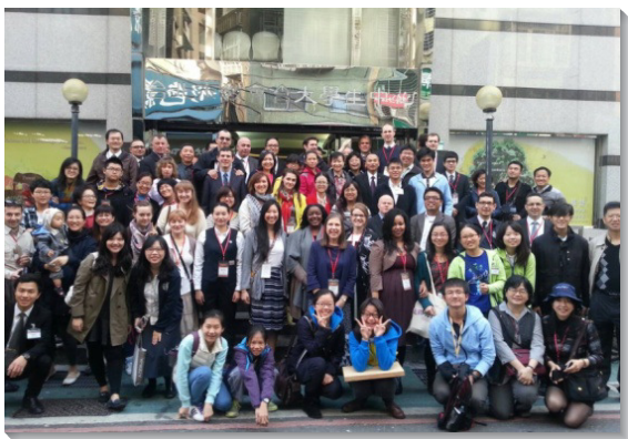
▲各地會所全體動員，配搭接待聖徒

本次特會接待人數之眾，時間之長，範圍之廣，規模可謂空前。除了逾五千位海外聖徒報名參加特會之外，為使眾人能實際的進入台島各地召會生活的豐富，弟兄們規畫了特會前後兩個梯次的相調訪問。由台北市五個大區（北、中、東、南一、南二）和新北市三個大區（新和、海山、重新）負責特會期間之接待。而台島各地也分成八個大區（基宜花東、桃園、竹苗、台中、彰投、雲嘉、台南、高屏），負責特會前後的相調訪問。不僅如此，為因應部分聖徒提前抵台，大會特別安排他們接待至中部相調中心，訪問中南部眾召會，務使每位聖徒得著最妥適的安排與照應。