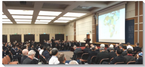
▲各國開展行動交通