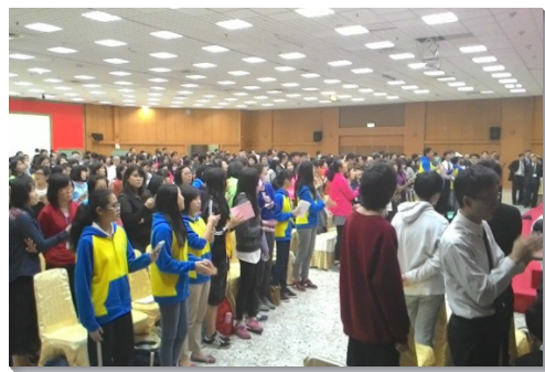
▲聖徒在會中歡樂唱詩

三天的聚集中，眾人歡樂的見證中，向主更新奉獻，宣告今年要帶家人得救、實行家聚會，餵養初信者、增排和增區。會後還有八位福音朋友受浸得救。眾人歡欣鼓舞，願主得著榮耀。 (林宗興)