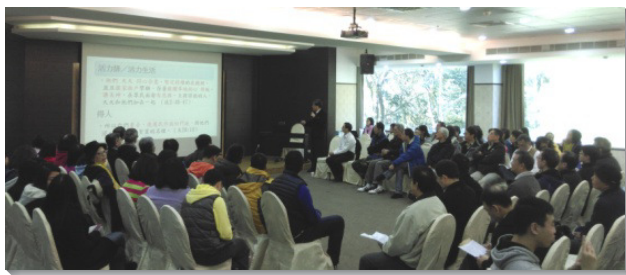
▲眾人聚集交通、研討，尋求突破

經過弟兄姊妹們同心合意的禱告尋求，決議將原有兩個大區的服事架構，調整為三個大區，每區主日聚會約有一百位聖徒，並有兩位負責弟兄擔負責任。再者，也安排每週固定外出傳福音，以及每月舉辦福音聚會。眾人共同研討，如何恢復活力的生活，並使召