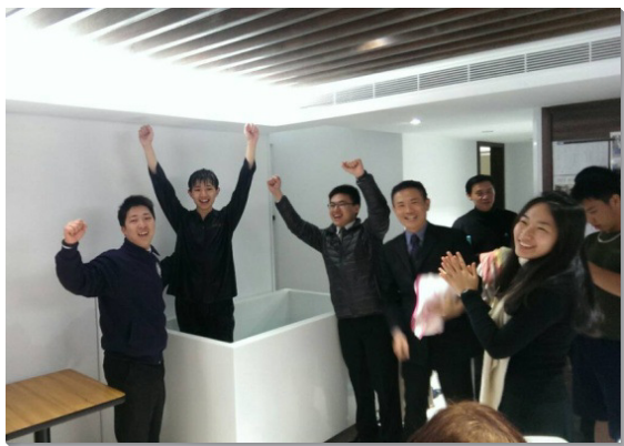
▲聖徒喜樂領人歸主

我們深信，在主裏的勞苦絕不是徒然的。我們不因人的拒絕而灰心，願意堅定持續走出去，與眾聖徒同心合意實行神命定之路，相信主必定祝福我們。（朱愛娜）