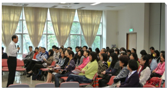
▲講師向志工們授課

二月十四及二十一日，得榮基金會於四會所舉辦社區志工培訓，有七十四位志工全程參與。值得一提的是，此次除了有北北基、桃園等地區的聖徒報名之外，還有弟兄姊妹遠從花蓮北上受訓，也有許多台灣科技大學和台北商業大學的學生一同參與。看見越來越多青年人願意奉獻一己之力，投身志願服務，著