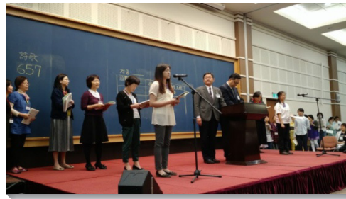
▲姊妹們在會中踴躍申言

弟兄們交通到，祭司乃是一班專門為神的權益活著並事奉神的人，他們接受神，被神充滿、浸透並浸潤，讓神從他們裏面流出來，以至於成為神活的表現。我