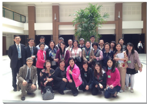
▲聖徒參加基礎造就聚會後合影