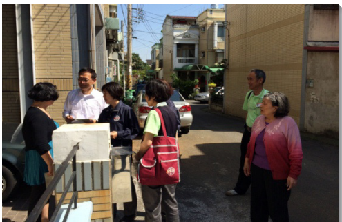
▲學員與聖徒配搭，挨家挨戶叩門

四月十四至十九日，壯年成全班共一百七十五位弟兄姊妹，分隊前往台北五會所、六會所、十會所、十一會所、十三會所、四十七會所，以及南投、台東、澎湖、金門…等二十三地配搭開展。學員們操練順從靈，否認己，經歷復活的基督，與各地聖徒配搭和諧。眾人同心合意，總共帶領一百四十二位新人得救，