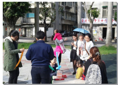
▲聖徒在公園接觸兒童及家長