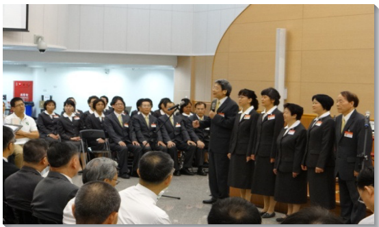
▲學員們向聖徒分享參訓蒙恩見證

週六早晨，三隊北上前往竹東鎮召會、頭份市召會、桃園市龜山區會所。途中一度遇雨影響車程，但學員們三三兩兩同心合意的禱告，勝過仇敵打岔的工作，靈中越發喜樂洋溢，在聚集中見證基督的甘甜和榮耀。會後，三處召會以豐盛的愛筵款待學員們；我們也抓住機會，與當地聖徒有甜美的交通，眾人裏外都得飽足。下午，全體學員會合於真理大學，邀請淡水的弟兄姊妹們與會。學員們合唱詩歌三四九首『奉獻一走主道路』、補充本第二十七首『在榮耀裏有一人』，