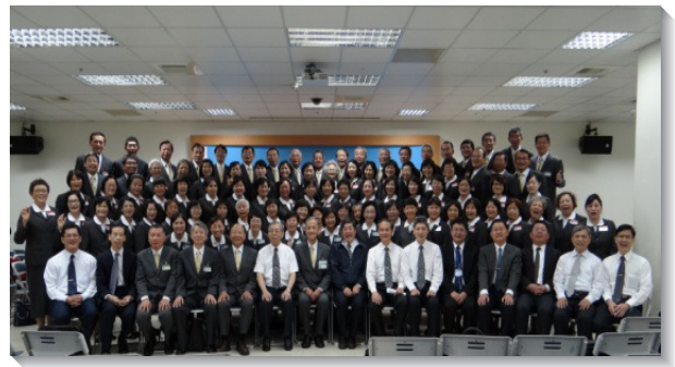
▲學員們與聖徒合影

主日早晨，各隊皆轉往台北市，其中兩隊會合於本召會二十九會所，與文山一區一千多位聖徒擘餅相調。因著輔訓與學員們充足的預備，儆醒的禱告，迫切的祈求，聖靈在會中得著出路，運行在聖徒中間。學員