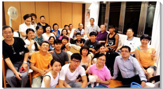
▲聖徒邀約初信者在家中聚集

餵養他們。一位初信者因病正接受復健，但她非常渴慕主話，姊妹們一週數次到她家中陪讀初信讀本，並且接送她參加主日聚會。還有聖徒們樂意在早晨五點半就帶著初信者上山，操練呼求主名，一同經歷聖靈的充滿。