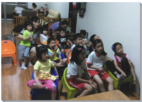
▲兒童們在聖徒家中聚集

五十五會所於今年成立，聖徒們同有託付，加強禱告、初信成全、和排生活的實行。我們積極傳福音，也殷勤經營排生活，盼望帶進召會的繁增。